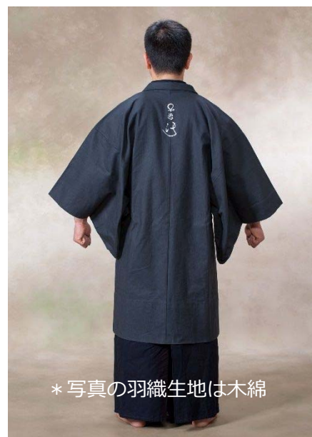
* 写真の羽織生地は木綿