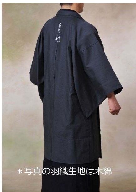
* 写真の羽織生地は木綿