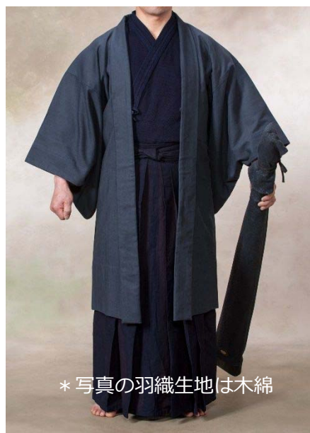
* 写真の羽織生地は木綿

『叙勲・還暦や古希・ご昇段』などのお祝い 餞別 ご自分用に 少量限定生産 お早めどうぞ!