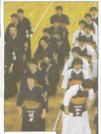
閉会式：健大選手たち

女子 健大高崎 連覇 ベスト8に商大付属 農二 男子 高工 農二がベスト8 ☆☆☆☆