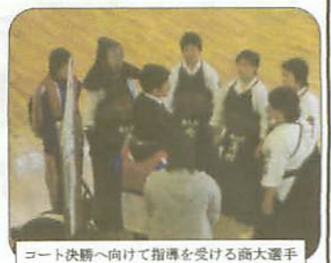
コート決勝に向けて指導を受ける商大選手

一月十八日、市武道館で一般向け剣道形講習会が開催されました。この日は午前中に剣道一級の審査が行われましたが、この講習会は連絡が行き届かなかったのか、一般の方々の参加はほとんどありませんでした。結局は講習会というより