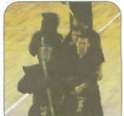
コート決勝を善戦した高工チーム

高崎からは男女それぞれ七校が出場しました。この大会は全国大会もあり優勝チームは三月二七・二八日と静岡県春日井市で行われる全国高校選抜剣道大会に挑戦することになります。注目は、男子高崎チームの中でベスト8の壁を突き破ることができるかどうか・また、女子は健大高崎の連覇なるか・それを阻止するチームが出現するかどうか・などでありましょう。結果男子は、高工と農二がベスト8に進出したが、高工は前商と