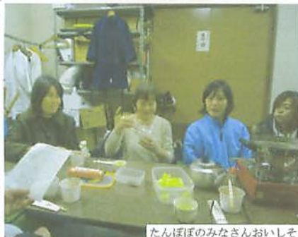
たんぼぼのみなさんおおいそう

がそれぞれ神聖なものだったのでしようね。白でついた餅は粘りが強くて、筆者の剣道術も白つき餅のように粘りがあるとい