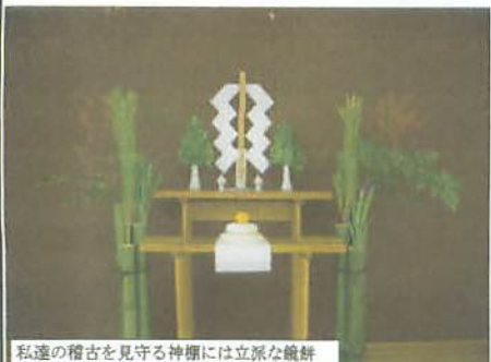
私達の稽古を見守る神棚には立派な鏡餅

セットされた目標を達成すべく皆さん頑張ってください。またみなさんの活躍を筆者のコンパクデ