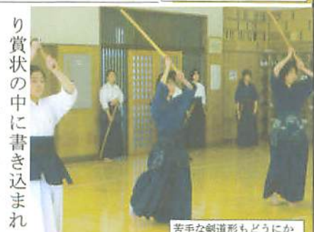
苦手な剣道形もどうにか

り賞状の中に書き込まれていると思います。やがて皆さんの手元に全日本剣道連盟会長による段位授与書が届くことでしょう。また、不合格になつた人は、もう一度自分の剣道を見つめ直して下さい。再挑戦を期待します。