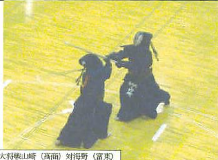
大将戦山崎(高商)対海野(富東)

大快勝であります。依然男子健大城は難攻不落です。続いて女子の模様です。娘のおつき合いで向こう上面の高商対富岡東を観戦。どちらを応援してよいやら。高商女子も