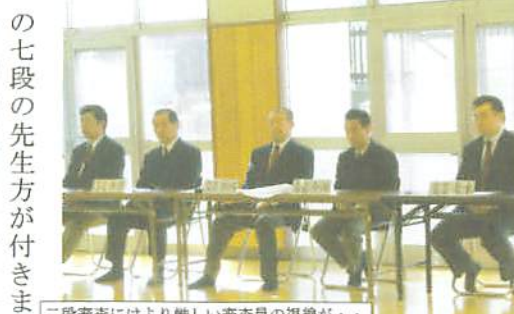
二段審査にはより厳しい審査員の視線が・・・

とにかく大きな声を出すこと・そうすれば気持ちには落ち着くものです。自分の持つていくものを全部出して下さい」と問いかけ、応じて全員「ハイイ」の答がありました。