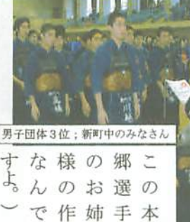
男子団体3位：新町中のみなさん