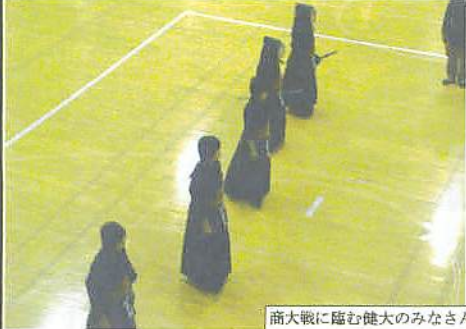
商大戦に臨む健大のみなさん

が、毎週木曜日高崎武道館に通ってくる商大生には馴染みが深い。商大は昨今剣道を目指す青少年が少なくなっているなか、うらやましいほどメンバーが揃っている。数からすれば当然インターハイを狙えるのですが。さて試合開始前のみなさんの姿をデジカメ一枚。あら!