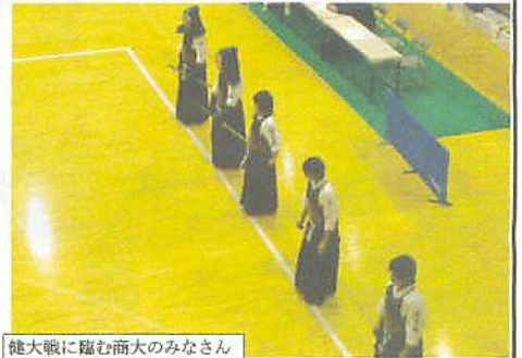
健大戦に臨む商大のみなさん

五人しつかりとメンバーが揃ってよかった。数年前はメンバーが揃わず3人で戦っていたこともあったと記憶している。この試合はどうやら高商に軍配が上がったようである。さて第一試合場へ戻ると。ファンである(筆者が)商大附属チームと健大高崎チーム戦の観戦です。高崎地区の私学校同士で、両校は剣道だけでなく他のスポーツでもこのほか好敵手同士だ。両方とも応援するんです