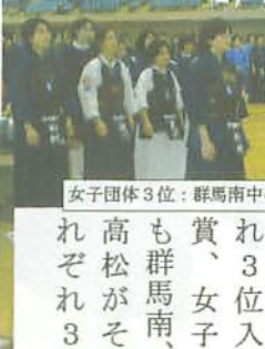
女子団体3位：群馬南中のみなさん

他にも良い試合が数多くありました。男子団体では倉渕、新町がそれぞれ3位入り、女子も群馬南、高松がそれぞれ3