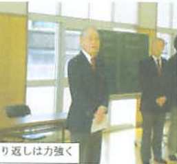
切り返しは力強く

一月十一日建国記念の日です。この栄えある日に高崎支部平成二十年度第二回初・二段審査会が高崎武道館で開催されました。