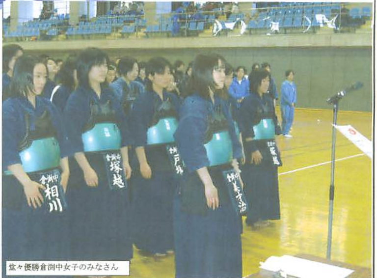
堂々優勝倉洲中女子のみなさん

一月二五日、藤岡庚申山体育館。今日は中学生西毛地区大会です。回を重ねること三八回となります。市町村合併が進み、今では高崎市、安中市、藤岡市、富岡市、多野郡、甘楽郡の4市2郡の中学校の大会となります。団体