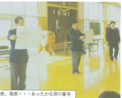
発表、発表・・・あったかな君の番号

の七段の先生方が付きまわりました。実技は十名ずつ行われました。審査の立ち合いにも初挑戦の先生がお若いのに落ち着いた捌きを魅せてくれました。でも内心きつとドキドキだったんですよ。審査員の厳しい視線が注がれる中、よく皆さん声が出て本当に剣道らしくみえま