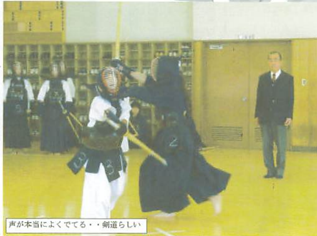
声が本当によくでてる・剣道らしい

校生及び一般の人が挑戦しました。二月一日にこの審査会に向けた実技、剣道形、そして学科の講習会が開かれ、挑戦者達ほとんどが、その講習会もマスター