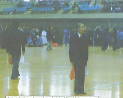
相河先生：寒い中の審判ご苦勞様でした。

カメラ(写りの悪い)がしつこく追いますぞお。寒い中を審判の労を頂いた高崎支部の先生方大変ご苦勞様でした。