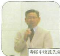
寺尾中学校長先生

平成十八 年四月二八 日、寺尾中 体育館で平 成十八年度 高崎市中体 連春季剣道 大会が開催 されました。 市内の中学 生剣士たち が数多く出 場しました。市内といっ ても今回からは・・・ そう、合併により多くの 学校が高崎の仲間になり、 隣の群馬郡の群馬町、箕 郷町倉渕村そして多野郡 の新町の三町一村の合併 により、それらの地区の 中学校がすべてこの大会 に参加です。榛名町も近々 合併の方向で進んでいる ようで、榛名中もこの高 崎市中体連に今回は参加 しております。こんなふ うに今回は新たな気分で といおうか、新たなスタ