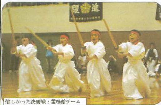
惜しかった決勝戦：雷鳴館チーム

員や各道場のお父さんお母さん方に集まっていたできました。昨年までは前日に準備できたのですが、今回前日は他のイベントのため準備が出来ず当日となりました。椅子