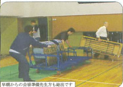
早朝からの会場準備先生方も総出です

りなど。なかなか普段の生活の中にない作業で結構労力がいらすよ。でも三十人近くの多くの皆さんに協力して頂いてましたライントープなど予め予想の寸法に裁断され