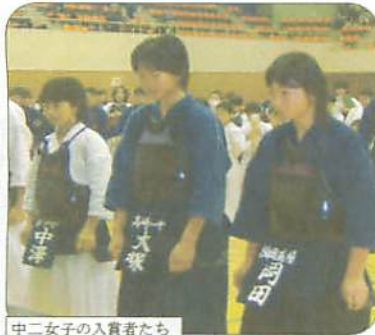
中二女子の入賞者たち

選手達と対戦するようになり、もうみんなみんな高崎の仲間です。大きくなった高崎。このたちみんなが未来へ向けて担っていくのです。稽古が終わった後の片付けには中学生が協力してくれた。中学生の片づけパワーは大間が片づきました。ありがとうございました。