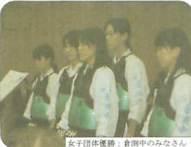
女子団体優勝：倉渕中のみなさん

団体戦男子は予想どおり 旧部員チームが一步リ ドの実力で新町中と榛名 中の決戦です。両校とも 実力伯仲一進一退で結局 勝者数は対。勝本数一本 の差で新町中に軍配が上 がりました。そして決勝 へは登れませんでした 佐野中が踏 ん張り粘り で三位に 入賞です。 女子も同 様で旧部 員チーム 一步リ ド。決勝 は倉渕中 と榛名中 です。こ ちらも実 力伯仲で 勝数三対 二で倉渕 中が榛名 中を退け ました。ま た三位、 四位に、 これも粘 って