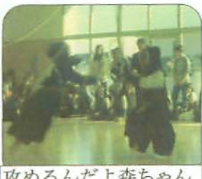
攻めるんだよ森ちゃん

手も一生懸命頑張りました。なかなか勝利の女神さんが笑ってくれない選手達もあきらめるなかれ。きつといっかわa・輝こうぞよ。